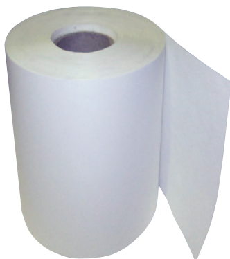
BANDA NT 30