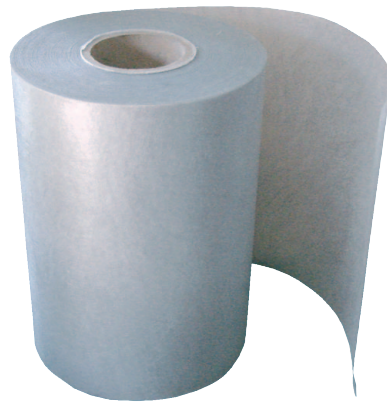
BANDA GT 30